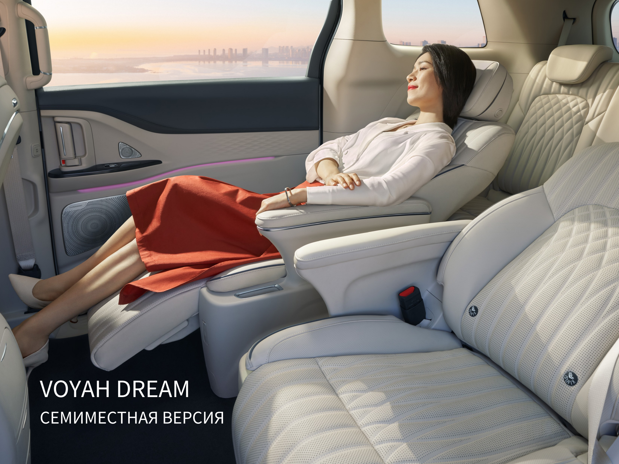
VOYAH DREAM СЕМИМЕСТНАЯ ВЕРСИЯ